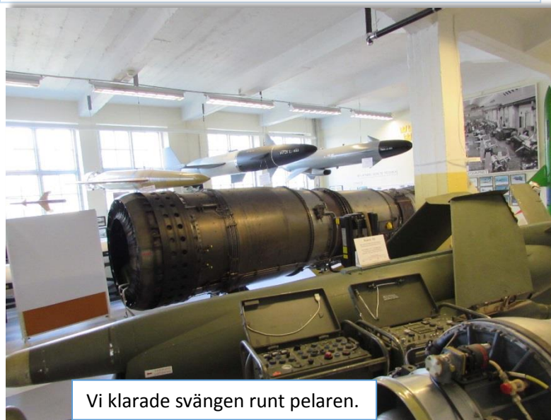
Vi klarade svängen runt pelaren.