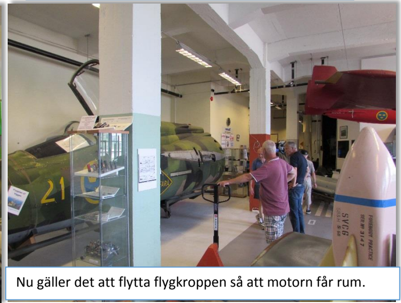
Nu gäller det att flytta flygkroppen så att motorn får rum.