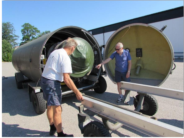
Antero o Pelle förbereder överflyttning till vagn.