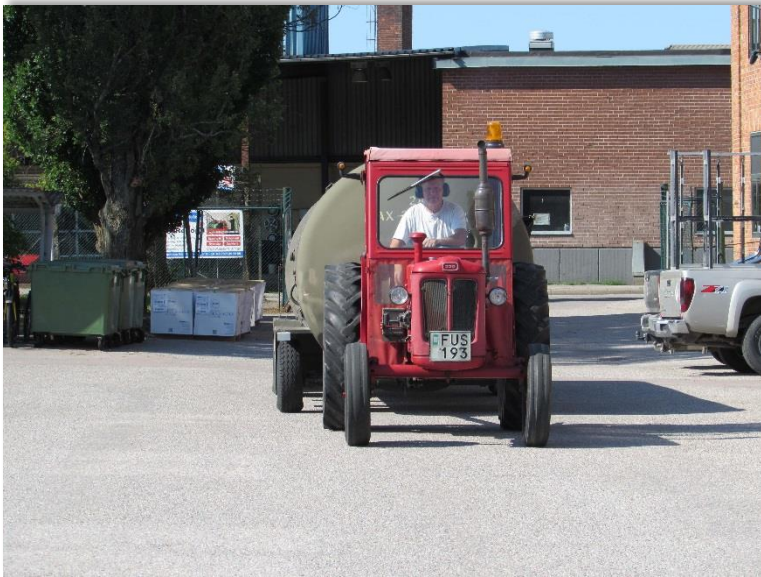
Motor RM8B på väg till Robotmuseet med Antero i traktorhytten.