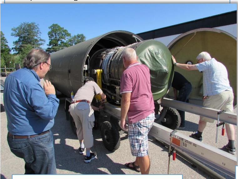
RM8B motorn på väg till transportvagnen