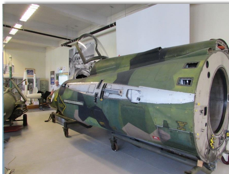
Nu är den på rätt plats.