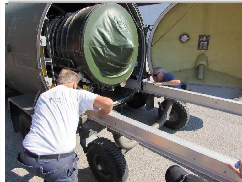
Nu fogas vagnen ihop med embalaget.