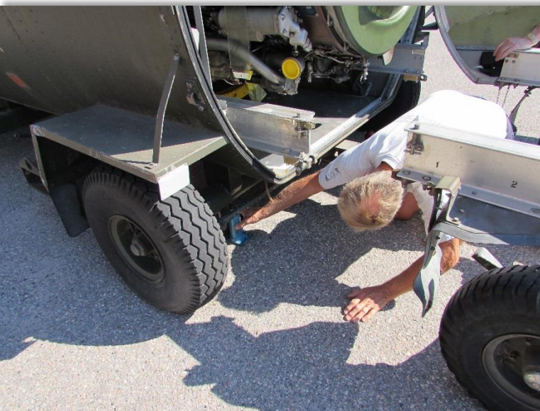
Domkraft på plats för att få rätt höjd mellan vagnen och transportembalaget.